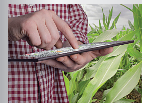
IMPIANTO DI ESSICCAZIONE 4.0 COMPLETAMENTE INTEGRATO NELLA TUA AZIENDA AGRICOLA