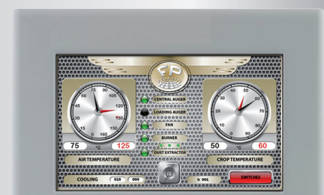
TOUCHSCREEN AVANZATO ASEM (HMI, WEB, REMOTE) PLC LOGO! 8 SIEMENS

SONO I GIGANTI DELLA FAMIGLIA. MASSIMA POTENZA E ALTE PRESTAZIONI. PROGETTATI PER LE AZIENDE AGRICOLE PIÙ MODERNE E DI GRANDE ESTENSIONE. SEMPRE PIÙ RICHIESTI E VENDUTI.