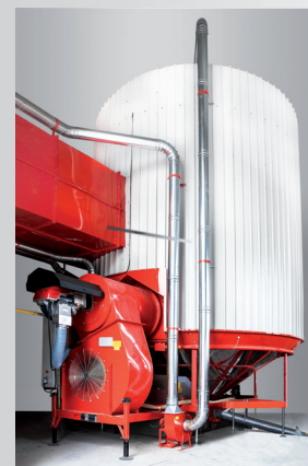
CARENATURA ANTIPOLVERE: COPERTURA TOTALE

IDEALE PER L'ESSICCAZIONE IN AMBIENTI CHIUSI