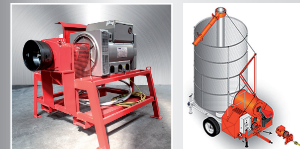
DUAL-DRIVE AZIONAMENTO ELETTRICO E A TRATTORE

IDEALE PER L'ESSICCAZIONE IN AMBIENTI CHIUSI